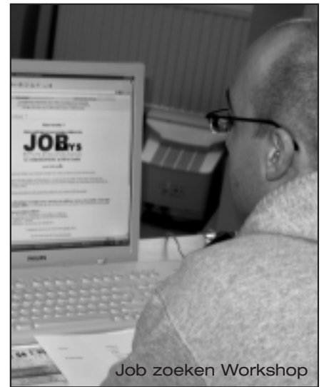
Job zoeken Workshop

Het Preventiehuis vergeet ook de dromen niet. Met zijn workshop verhalen vertellen, biedt ze kleine en grote kinderen de kans de wereld van de verbeelding te (her)ontdekken. Ouders en peuters: afspraak op dinsdagochtend tussen 9 en 12 uur, met