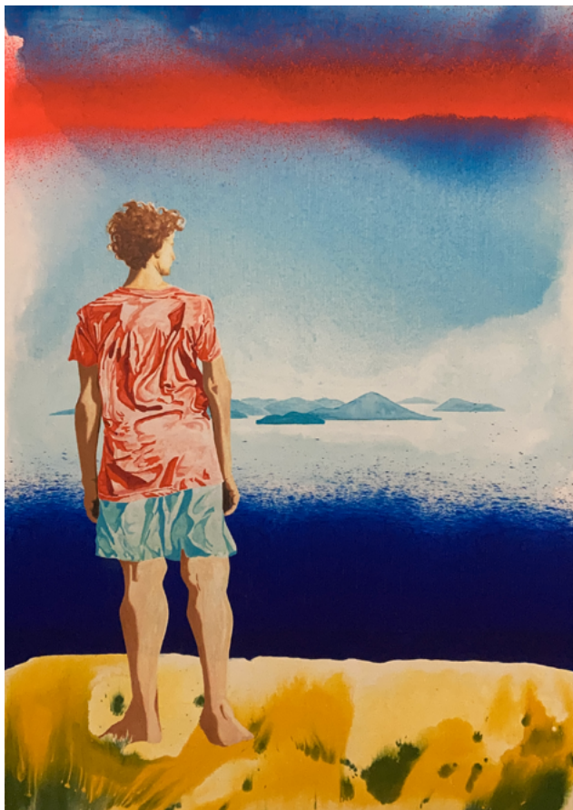
Pressentiment 2 (Ekstasis) , huile et couleur vinylique sur toile, 150 x 100 cm, 2025