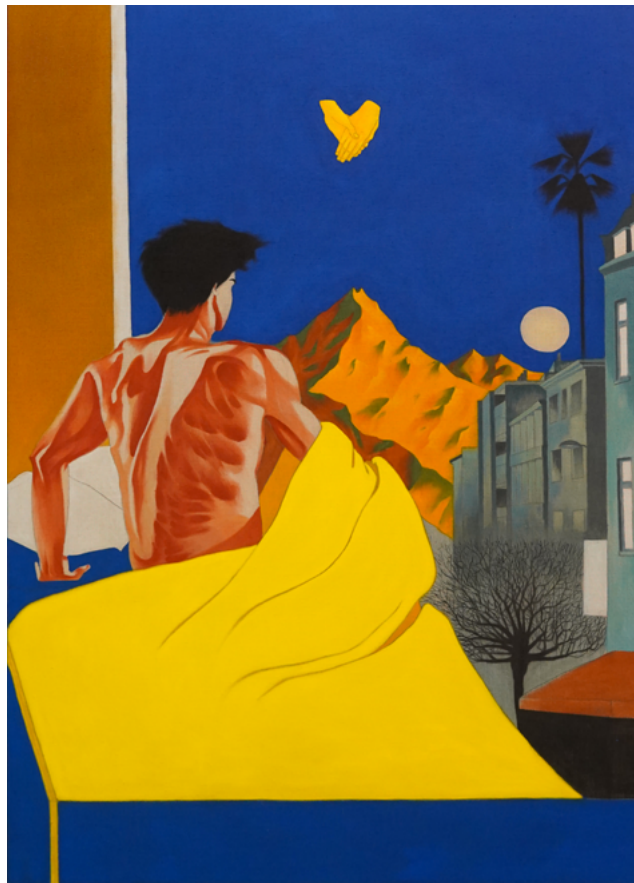
Nuit diurne ( Voyage au bout de la nuit ), huile sur toile, 160 x 110 cm, 2021

Au cœur de l'hiver à Rouge-Cloître, Laurent Poisson ne manquera pas de réveiller nos sens par sa palette ardente et son approche vivifiante de la peinture contemporaine.