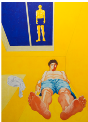
Chambre funéraire ( Voyage au bout de la nuit ), huile sur toile, 200 x 150 cm, 2024