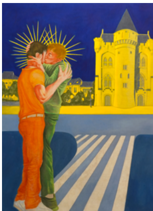
Le baiser ( Voyage au bout de la nuit ), huile sur toile, 200 x 150 cm, 2023