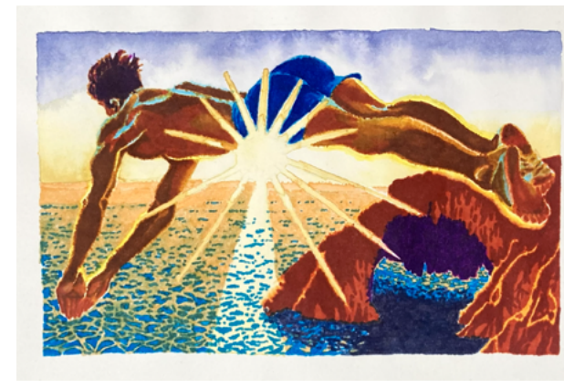
Image-souhait 2 ( Ekstasis ), aquarelle et feutre sur papier, 12 x 18,5 cm, 2024